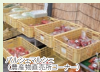
パルシェマルシェ(農産物直売所コーナー)