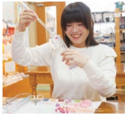
体験・ハーバリウム作り

■手作り体験メニュー ポタニカル香水、ジェルキャンドル、ハーバリウム、お香、ハーブ石けん、フラワーアレンジメントリース