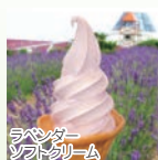
ラベンダーソフトクリーム