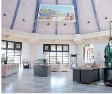
■エントランスホール

ハーブの香りがほのかに漂う客室は、美しい夕日と播磨灘を見下ろす至高の眺めが魅力です。併設する香りの湯は、弱アルカリ性の天然温泉で世にいう美人の湯の泉質をお楽しみいただけます。静かな淡路島で癒やしのひと時をお過ごしください。