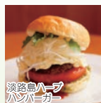
淡路島ハーブハンバーガー