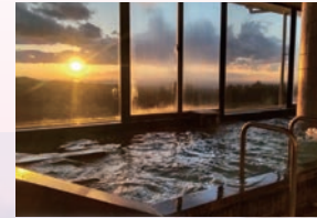
■香りの湯からの夕日