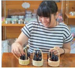
体験・ポタニカル香水作り