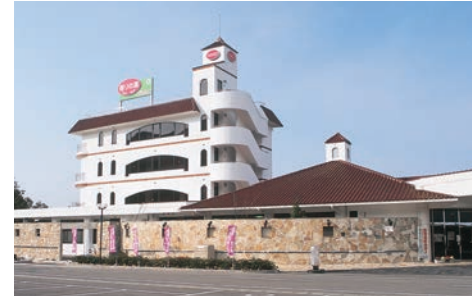
■香りの宿 香りの湯に隣接した、眺望が良い宿泊施設。